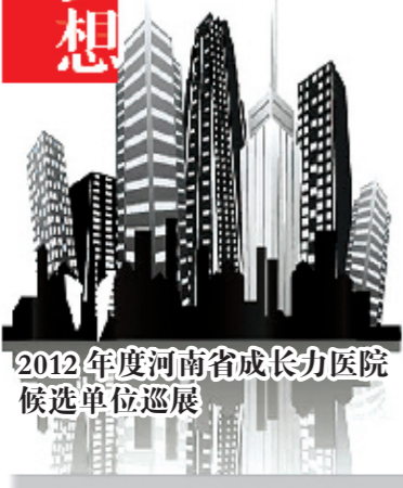
2012年度河南省成长力医院候选单位巡展